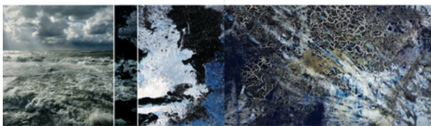
4. AVEC LE TEMPS